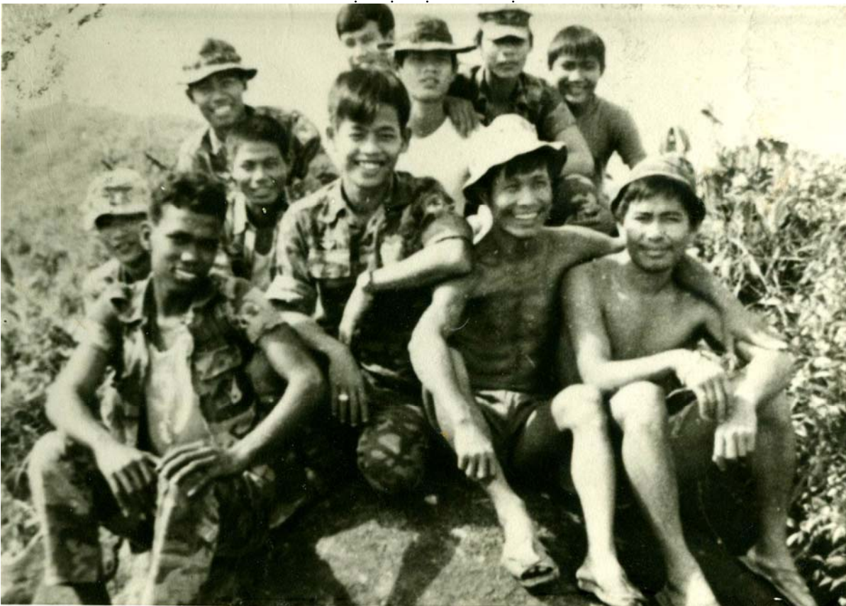
ĐĐ92 Dù- Quảng Nam 1974 - Club Đầu Mây Chân Gió