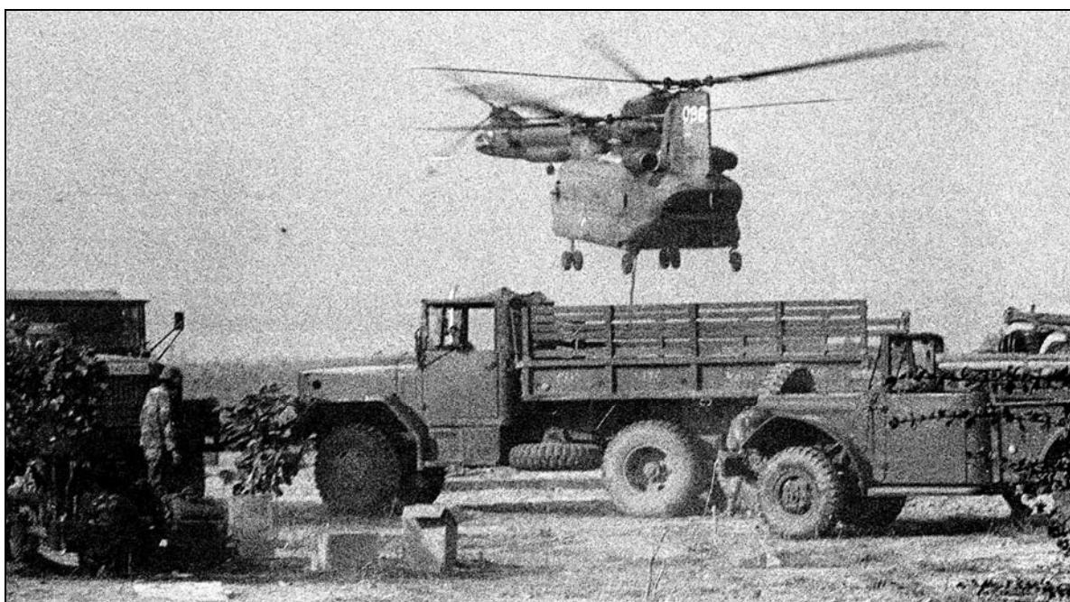
Tất cả cho tiền tuyến